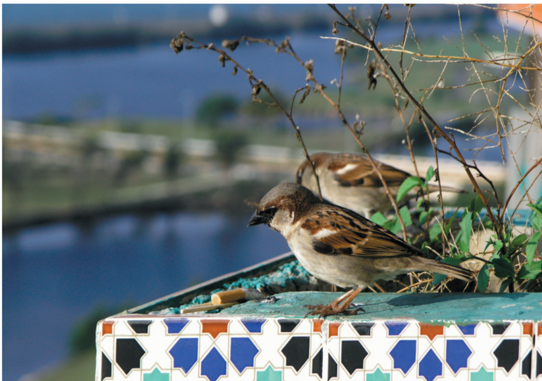
passer domesticus, Kuba, 2005