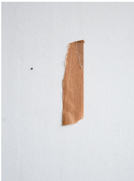
o.T. (Knochenband # 05), 2008 C-Print, 40 x 30 cm