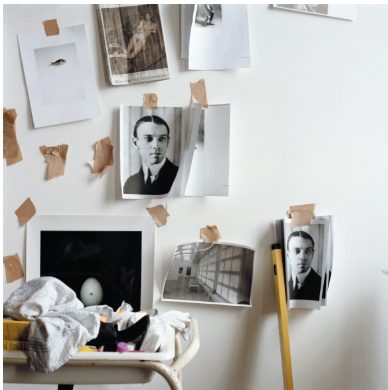
wand 30.07.2008 C-Print, 60 x 60 cm